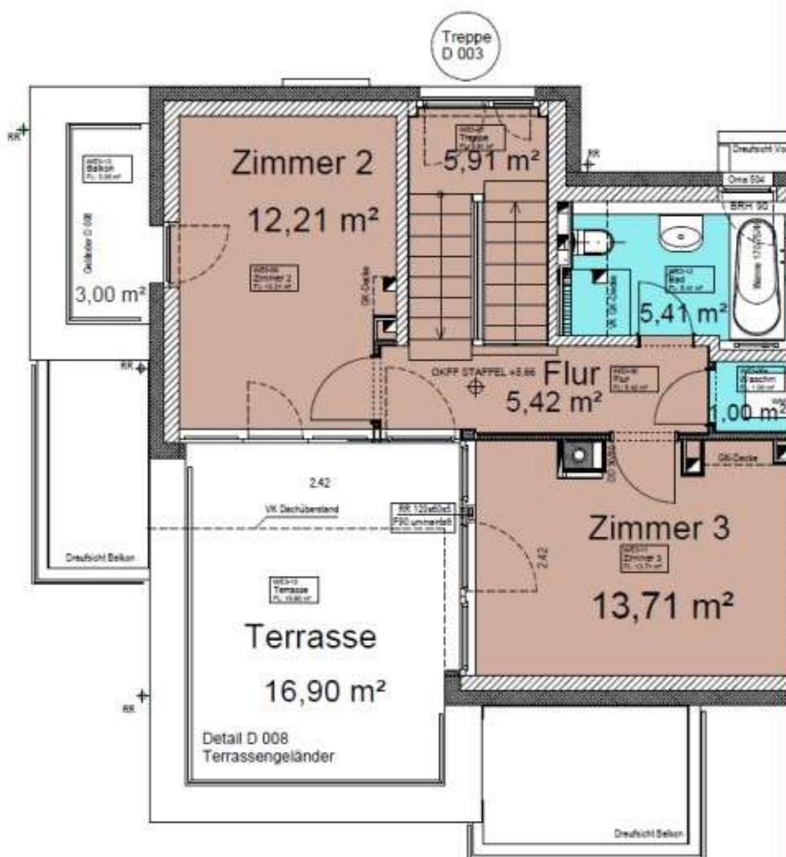
Grundriss Staffelgeschoss - 1:50

Zimmer: 4,00 Wohnfläche ca.: 106,00 m 2 Kaltmiete: 1.802,00 EUR (zzgl. Nebenkosten) Gesamtmiete: 2.160,00 EUR